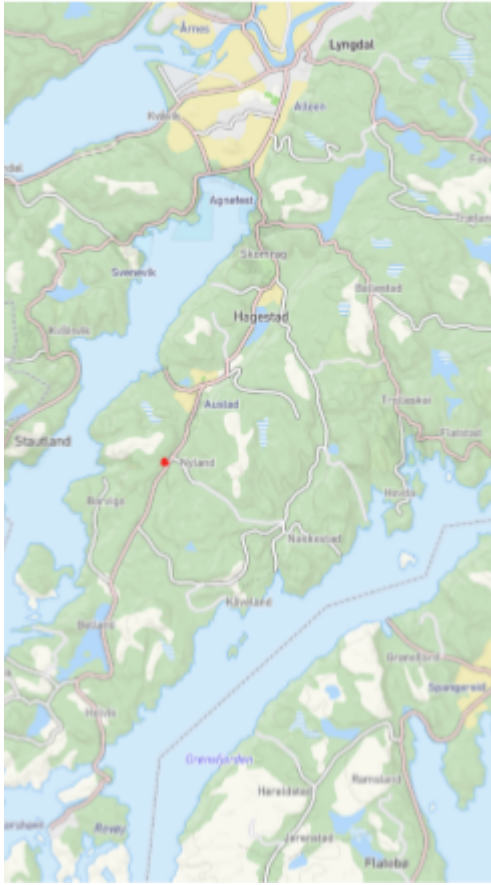
Oversiktskart. Markering angir sted.